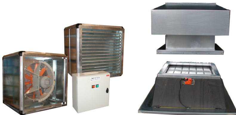
Kabinett for vegg- eller gulvmontering